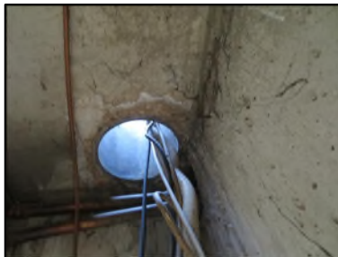
Photo N° 598 AMIANTE CIMENT -- GAINE TECHNIQUE 4 Conduits de fluide Ventilation haute (Fibres- ciment)