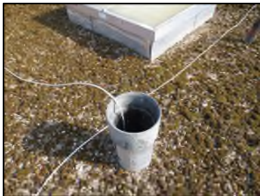
Photo N° 597 AMIANTE CIMENT -- Toiture terrasse Conduits de fluide Ventilation haute (Fibres-ciment)

Dossier n°: 2013-09-300 FK DTA PC_077LAF_OPH